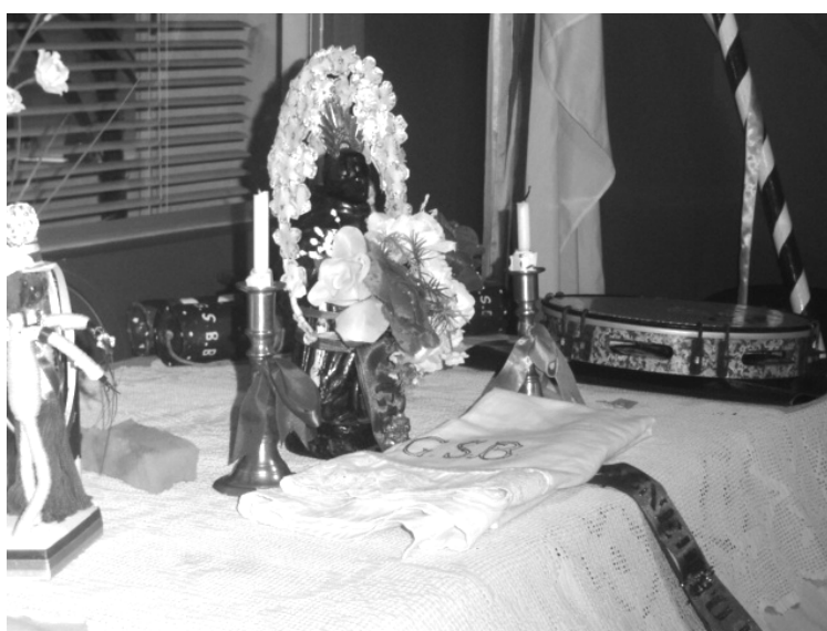
Foto 10: São Benedito da Praia, em altar durante o ritual de Esmolação.