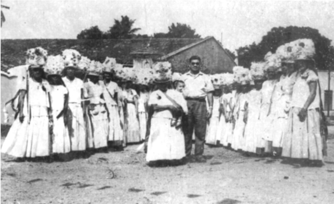
Foto 5: Marujas na festa de São Benedito, em Bragança (década de 1960).