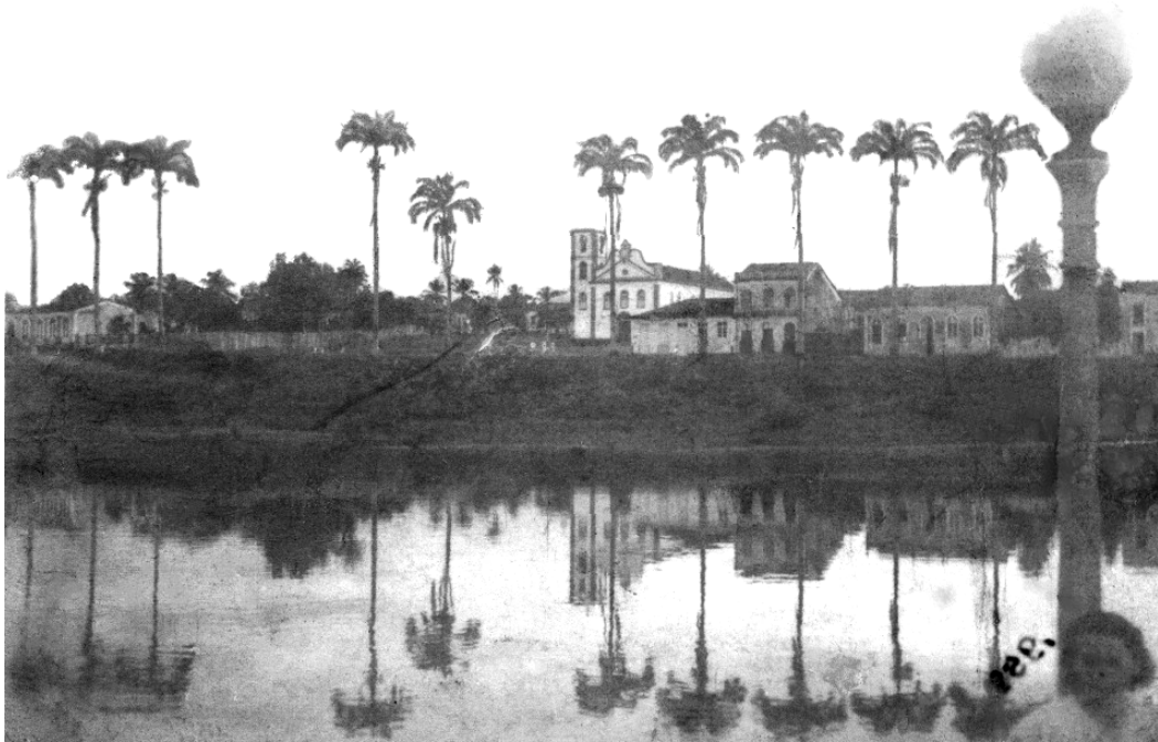
Foto 4: Frente de Bragança, em imagem tradicional (década de 1950).