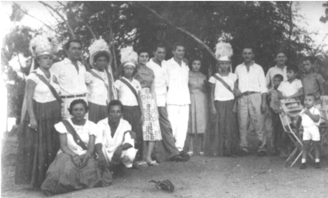
Foto 3: Um arraial de São Benedito, em Bragança (década de 1960).